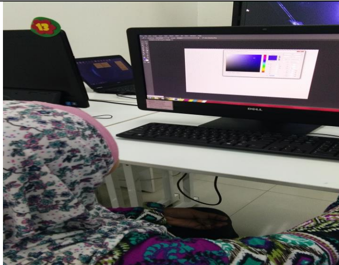
Gambar 1:Peserta sedang memilih warna untuk membuat logo.