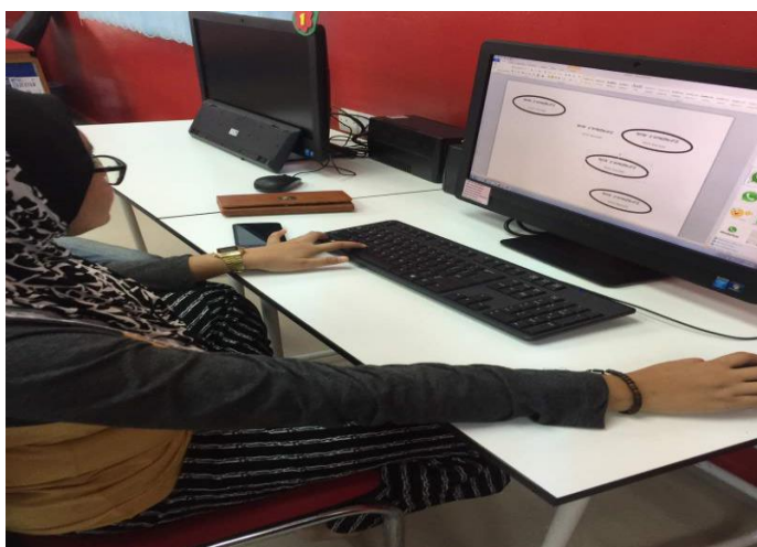
Gambar 2:Peserta berjaya membuat label produk menggunakan Microsoft Word.

Photo caption names Keterangan gambar beserta nama