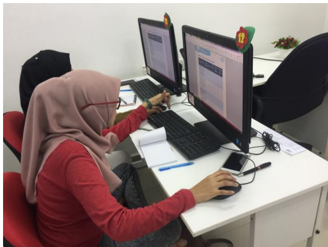
Gambar 1:Peserta mengisi borang pra kursus Intel EBasic.