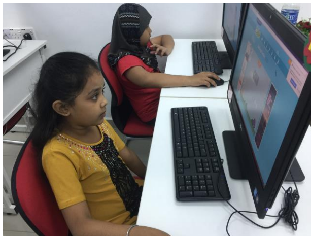
Gambar 2:Peserta tekun membuat 'alphabet matching'