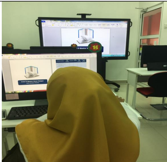
Gambar 2:Peserta membuat logo perniagaan