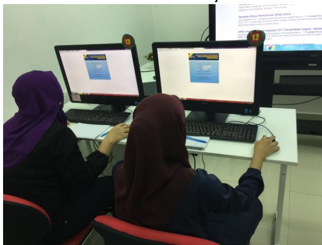
Gambar 1:Peserta mendaftar di web SPA.