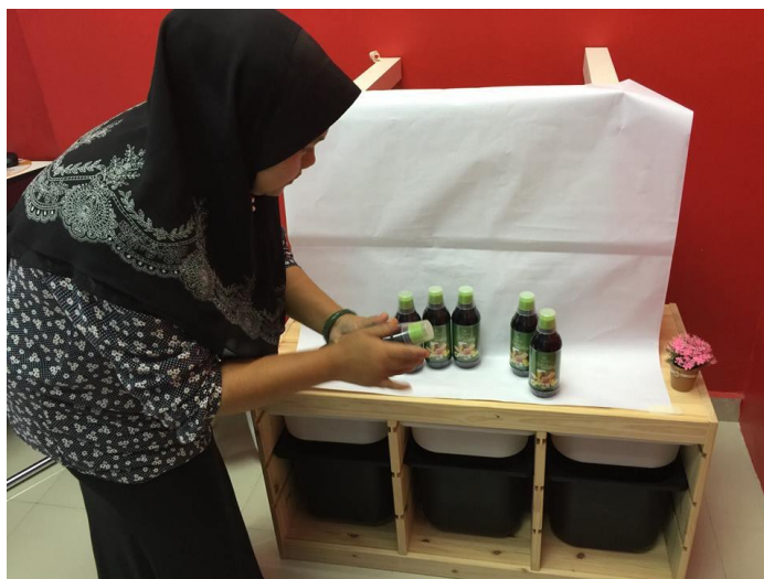
Gambar 2: Peserta memasukkan produk untuk diiklankan di dashboard PI1M.